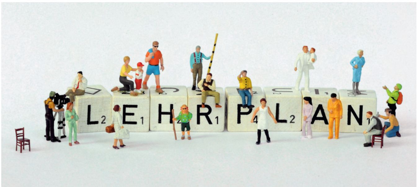
Noch eine Baustelle: Der Lehrplan 21 ist in Entwicklung.

Der Lehrplan 21 wird kompetenzorientiert ausgestaltet. Dabei wird der Blick verstärkt auf die Anwendbarkeit von